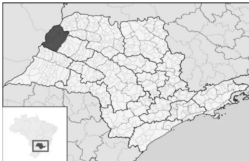
Figura 1: Microrregião de Andradina (área em destaque).