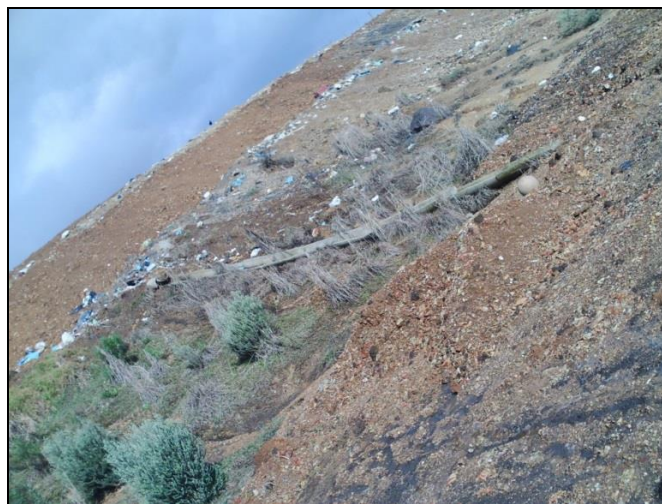
Figura 8 - Sistema de drenagem pluvial obstruído.