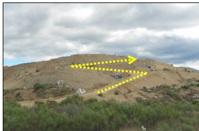
Figura 6 - Via de acesso à frente de trabalho.

As vias de acesso à frente de trabalho (Figura 6) se encontravam em uma inclinação acima do desejado, fazendo com que, principalmente em dias chuvosos, os caminhões de coleta dos resíduos não conseguissem chegar ao local adequado para a disposição dos resíduos, acarretando na disposição em lugares inadequados.