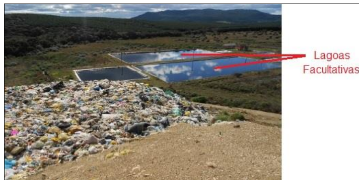
Figura 3 - Lagoas Facultativas do Aterro Sanitário Municipal.

Já as lagoas facultativas (Figura 3) são a variante mais simples dos sistemas de lagoas de estabilização. Basicamente, o processo consiste na retenção de efluentes líquidos por um período de tempo longo o suficiente para que os processos naturais de estabilização da matéria orgânica se desenvolvam (Von Sperling, 2005).