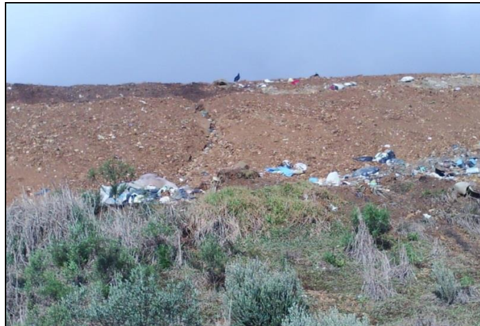
Figura 9 - Taludes definitivos sem cobertura vegetal.