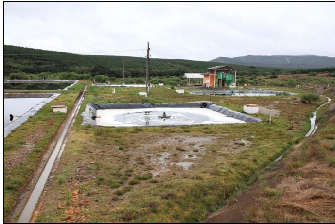
Figura 4 - Lagoa Aerada do Aterro Sanitário Municipal

As lagoas aeradas (Figura 4), por sua vez, dependem da introdução artificial do oxigênio requerido pelos organismos decompositores da matéria orgânica solúvel e finamente particulada. O oxigênio é fornecido por aeradores mecânicos os quais se constituem de equipamentos providos de turbinas rotativas de eixo vertical que causam um grande turbilhonamento na água através de rotação em grande velocidade facilitando a penetração e dissolução do oxigênio.