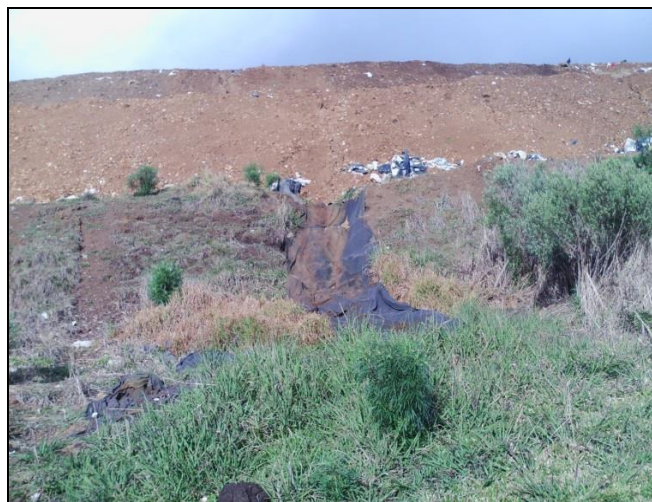
Figura 7 - Deficiências na drenagem pluvial.

A ausência do sistema de drenagem pluvial (Figura 7) acarreta em problemas como a erosão dos taludes e aumento na vazão dos sistemas de tratamento. Os sedimentos erodidos pela ação das precipitações acabavam obstruindo os sistemas de drenagem já existentes (Figura 8), o que agravava ainda mais o problema. Como a vazão do sistema aumentava o mesmo ficava sobrecarregado em períodos de precipitação demasiada, havendo situações de transbordo nas lagoas.