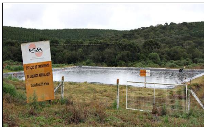
Figura 2 - Lagoa Anaeróbia do Aterro Sanitário Municipal.

Em relação ao tratamento biológico, a lagoa anaeróbia (Figura 2) é uma das unidades de tratamento, onde a existência de condições estritamente anaeróbias é essencial. Isso é alcançado através do lançamento de uma grande carga de DBO (Demanda Bioquímica de Oxigênio) por unidade de volume da lagoa, fazendo com que a taxa de consumo de oxigênio seja várias vezes a taxa de produção; cujo valor balizador é de 3 mg/L O 2 para águas doces da classe I, conforme Resolução CONAMA nº 357 de 2005.