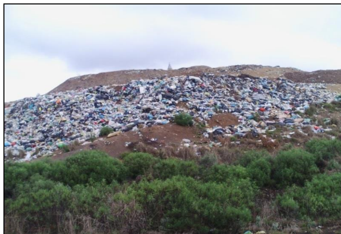
Figura 10 - Resíduos sólidos sem cobertura.

Durante todo o período de visitas feitas ao aterro sanitário observou-se resíduos sólidos sem cobertura (Figura 10), o que resultava na emissão de gases poluentes e na presença de animais vetores de doenças.