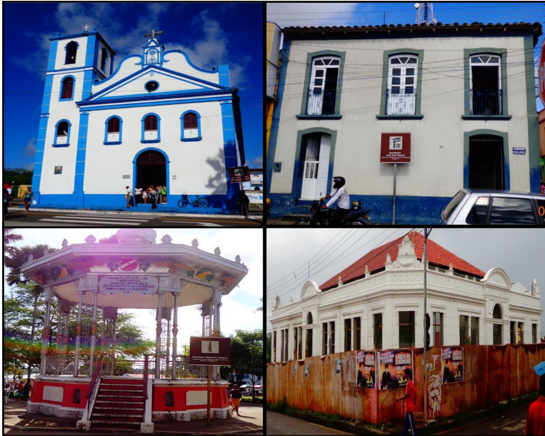
Figura 04- Mosaico de fotos de alguns dos bens tombados pela Prefeitura Municipal de Bragança. Da esquerda para direita: 1-Igreja de São Benedito; 2- Imóvel de João Paes Ramos; 3- Coreto Pavilhão Antônio Lemos; 5- Mercado de Carne (atualmente está reformado, 2018).

Fonte: Trabalhos de campo realizado entre os meses de julho de 2012 a dezembro de 2013.