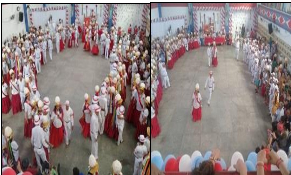
Figura 05- Mosaico de fotos da Marujada de São Benedito em Bragança.

Carvalho (2010) a Marujada de São Benedito, figura 05, é apontada como a principal manifestação cultural e turística de Bragança. Ressalta a importância de valorizar os aspectos histórico-culturais da região com o intuito de contribuir com o desenvolvimento do turismo. Acredita-se que a Marujada de São Benedito é um patrimônio cultural com particularidades e riquezas e que deve ser conservado para gerações futuras.