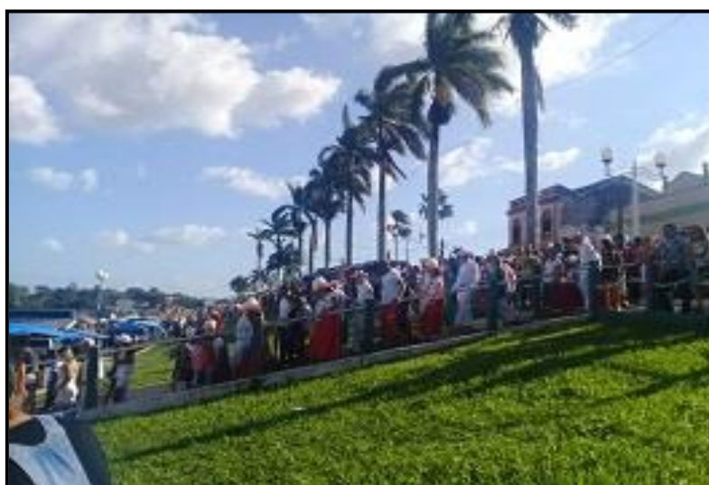
Figura 03- Procissão em homenagem a São Benedito. Realizada no dia 26 de dezembro de 2018, na orla da cidade de Bragança, Pará, Brasil.

Por isso nesta pesquisa trabalha-se com a possibilidade de pensar a implementação de um turismo cultural sustentável a partir das bases que envolvem a ativação do patrimônio-territorial (COSTA, 2016; 2017). O patrimônio-territorial apresentado por Costa (2016) apesar de ser um utopismo, serve para reflexão da realidade latino-americana quanto as “novas proposições preservacionistas em face de particularidades da urbanização e da construção social de riscos na América Latina” (p. 2). O patrimônio-territorial