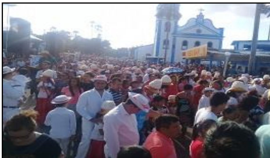
Figura 02- Largo de São Benedito. Saída da procissão em homenagem ao Glorioso São Benedito, Bragança, Pará, Brasil, realizada no dia 26 de dezembro de 2018. Ao fundo a Igreja de São Benedito, edificação do século XVIII, tombada pela Poder Público Municipal e Estadual. Fonte: Trabalho de campo. Acervo pessoal da autora, 2018.