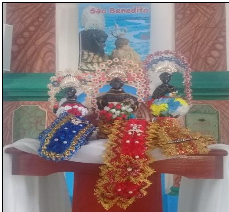
Figura 06- Encontro das imagens na igreja de São Benedito. São imagens dos santos que percorrem o nordeste paraense nas esmolações. São Benedito da praia, São Bendito dos campos e São Benedito das colônias.

Ressalta-se que a Marujada é muito além de um conjunto de danças, transcende aquilo que é dito, revelado em palavras por aqueles que experimentam a alegria e gratidão a São Benedito ou para quem participa de forma atenta como destacou Carvalho (2010).