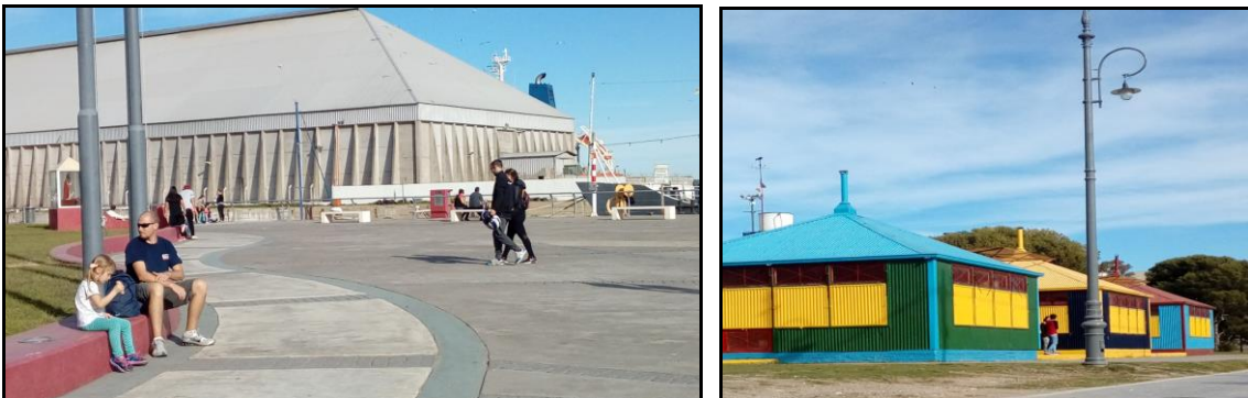
Figuras 2 y 3: Paseo del Puerto y “Cantinitas”, respectivamente.

La lógica turístico recreativa en Ingeniero White se articula a partir de dos grandes tipologías de espacios de ocio: espacios históricos con uso turístico recreativo y aquellos de carácter contemporáneo. Entre los primeros, se pueden destacar sitios que se emplazan en torno al sector costero, entre éstos el Paseo del Puerto, conformado por una “plaza seca” en el Muelle Nacional (Figura 2); y el Balcón al Mar, erigido en el lugar en el que se localizaba el antiguo muelle de hierro que dio origen al poblado, ambos puestos en valor por el Consorcio de Gestión del Puerto de Bahía Blanca. Por otro lado, los dos museos locales: Ferrowhite y Museo del Puerto; y el Club Náutico. Los restantes espacios se localizan en el ejido urbano de la ciudad: la Av. Guillermo Torres con sus características “cantinitas” (Figura 3), representativas de los orígenes del puerto; la Plaza Roberto Achaval, estructurada sobre los terrenos del ferrocarril; y el Teatro de Ingeniero White, asociado a la colectividad italiana, de gran relevancia en los inicios de la localidad. Entre los espacios contemporáneos se resaltan el boulevard de la Av. San Martín; los clubes deportivos; la pista de salud emplazada en el ingreso de la ciudad; y las plazas Héroes de Malvinas y Malvinas Argentinas.