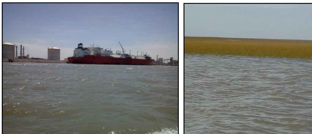
Figura 4: imágenes de navegación por el Estuario de la Bahía Blanca.

Como parte del perfil de la demanda, se identifican visitantes de localidades próximas, contingentes de escolares y turistas internacionales que se alojan en Bahía Blanca como centro de escala hacia el sur del país. Entre las razones de este escaso uso turístico, se encuentra la ausencia de equipamiento de alojamiento, que se reduce a un solo establecimiento de carácter modesto, utilizándose la ciudad de Bahía Blanca como lugar de pernocte, concentrando así la totalidad de los flujos turísticos que genera el puerto, principalmente de carácter corporativo y de negocios.